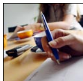
Idealna dla wszelkich zastosowań