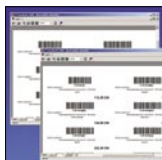
Oprogramowanie dla formularzy i etykiet