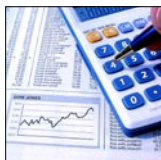
Oszczędność kosztów dzięki drukowi dwustronnemu