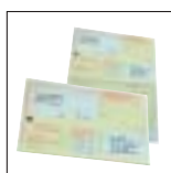
Krankschreibungen und Rezepte