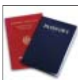
Reisepässe, Sparbücher und Servicehefte