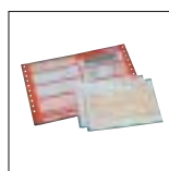
Überweisungsträger und Kurierbriefe

SEIKO Precision Solutions for all your printing needs